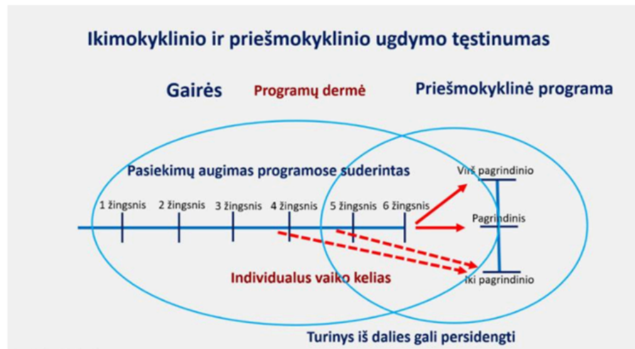
2 pav. Ikimokyklinio ir priešmokyklinio ugdymo programų dermę ir tęstinumas

Ikimokyklinio ugdymo programa užtikrina nuoseklų ir sistemingą vaiko galių augimą, ikimokyklinio ir priešmokyklinio ugdymo programų dermę ir sklandų tęstinumą bei perėjimą iš vienos programos į kitą. (2 pav. ).